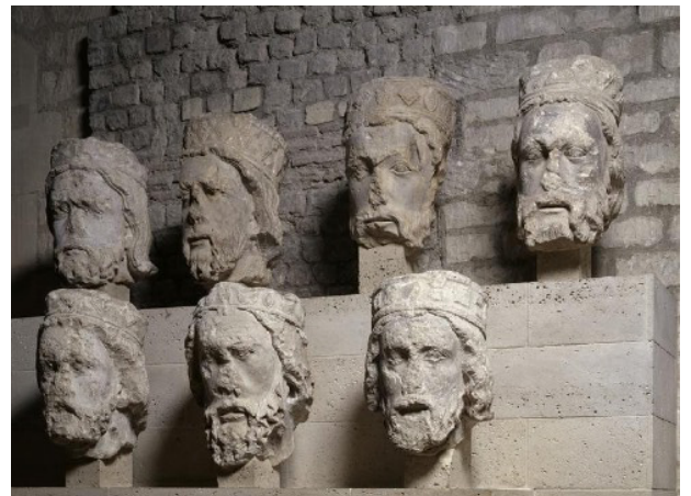
Têtes des rois de Juda provenant de Notre-Dame de Paris, Paris, musée de Cluny - musée national du Moyen Âge. ©RMN-Grand Palais / Gérard Blot

Dans le même temps – cette période aux contours indécis de l'enfance et de la première adolescence - le musée de Cluny a été mon « premier musée » : très proche de l'immeuble où vivait ma famille, il incarnait dans une globalité imprécise et mystérieuse ce que je découvrais, comprenais, aimais du Moyen Âge, perçu tout à la fois comme le temps de la Dame à la Licorne, comme celui des cathédrales. L'année 1977 n'est pas seulement pour moi celle du baccalauréat, c'est aussi celle d'un événement archéologique qui pour la première fois rencontre ma petite vie personnelle : la découverte, à la faveur de travaux conduits dans la cour