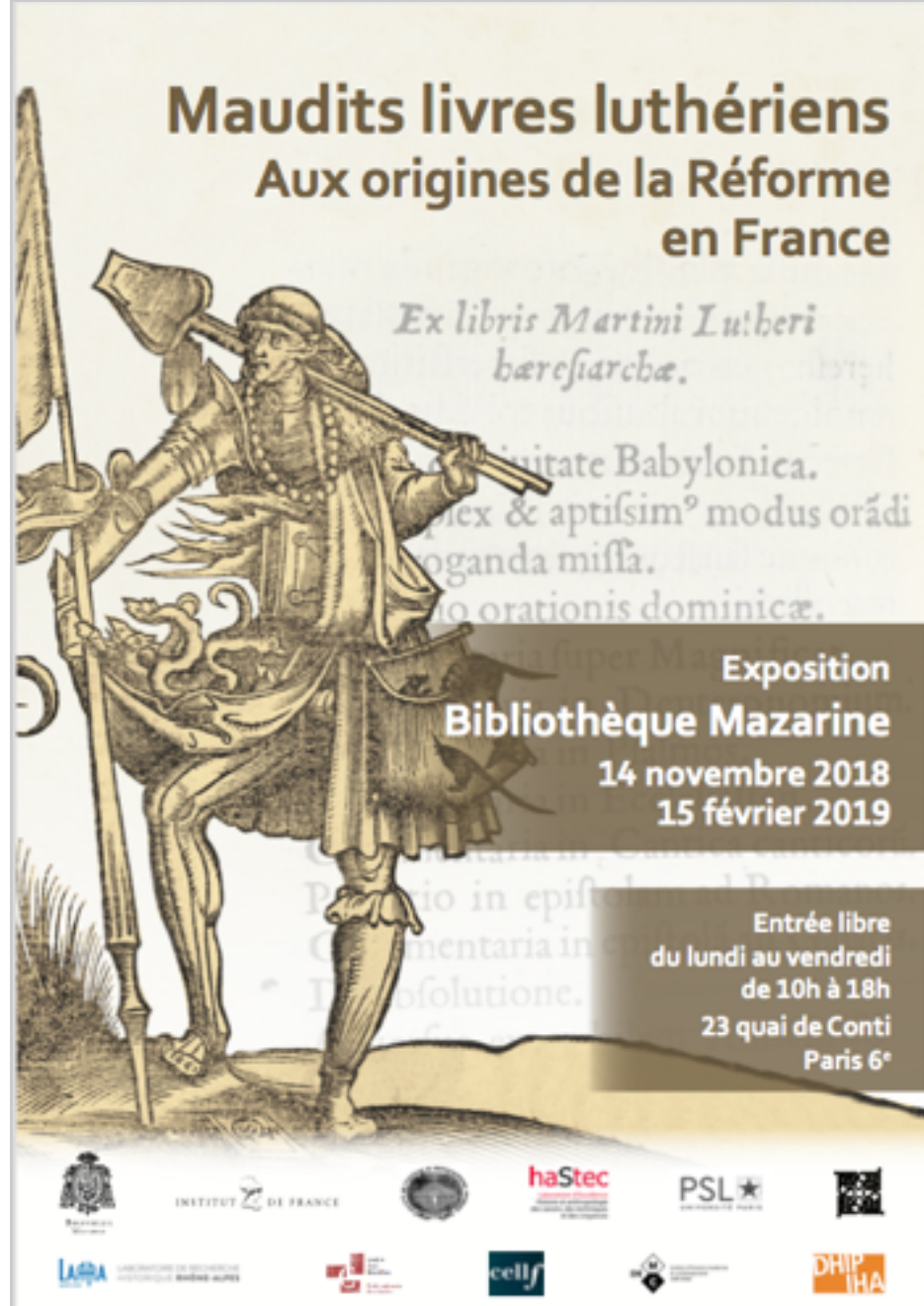
Maudits livres luthériens. Aux origines de la Réforme en France, du 14 novembre au 15 février à la Bibliothèque Mazarine, Paris.

Elle accueille aujourd'hui chercheurs, étudiants et visiteurs du monde entier, dans un cadre architectural conçu au 17 e s. C'est à la fois un service de documentation pour l'histoire médiévale et moderne, un musée du livre, et un centre de recherche sur le patrimoine écrit. Elle est notamment le siège de la revue internationale Histoire et civilisation du livre ; et développe une offre numérique à travers sa bibliothèque virtuelle, Mazarinum , qui valorise les corpus les plus précieux.