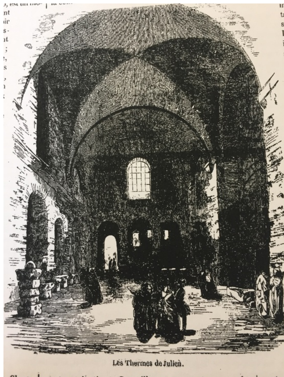
"Entrée de l'hôtel de Cluny" et "Les Thermes de Julien", Tableau de Paris d'Edmond Texier, 1853