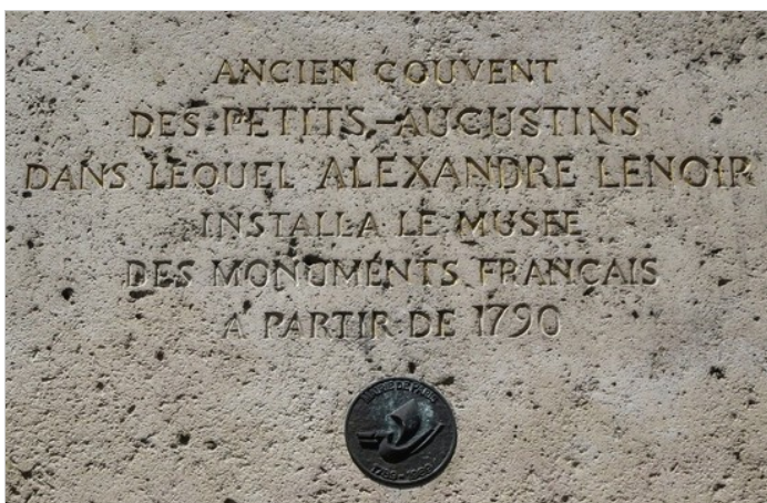
Couvent des Petits-Augustins, Paris