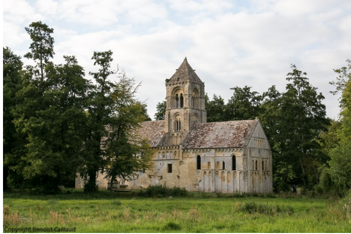
Eglise de Thaon - Vue générale de l'église Saint-Pierre, dans la vallée de la Mue.