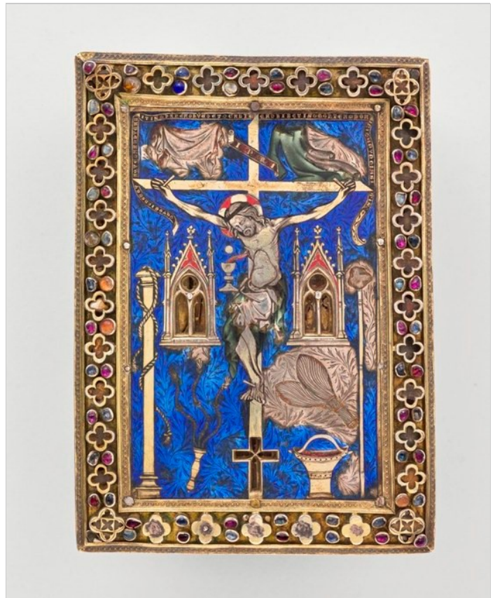
© Tableau-reliquaire : Crucifixion Paris? Milieu 14e siècle Cl.23920 Localisation : Paris, musée de Cluny - musée national du Moyen Âge Photo (C) RMN-Grand Palais / Michel Urtado

Si la subtile figure du Christ rappelle celles de Jean Pucelle et évoque le milieu parisien, la maîtrise de la basse-taille et les motifs végétaux incisés sous l'émail bleu suggèrent une datation vers le milieu du XIV e siècle.