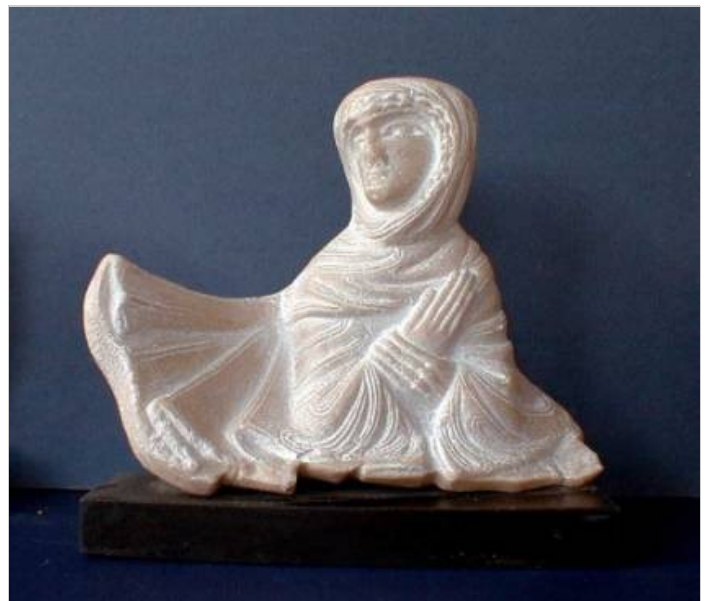
Sainte femme - 22 x 18 cm - Moulage du Maître de Cabestany - Abbaye de Saint-Hilaire Alphonse Snoeck

Un sculpteur inconnu y ciselait des visages triangulaires, aux yeux en amande et aux pupilles trépanées, des personnages aux longues mains fines, vêtus de drapés serrés, intégrés dans une dramaturgie minérale poignante. Cet anonyme magistral, dont les œuvres remontent à la fin du XII e siècle, reçut alors le nom de « Maître de Cabestany ». Depuis lors, plus de 120 pièces sculptées (chapiteaux, sarcophages, modillons) ont été portées à son actif (du moins à celui de son atelier) dans un périmètre qui englobe la Catalogne sud et nord (église du Boulou, prieuré de Monastir del Camp,